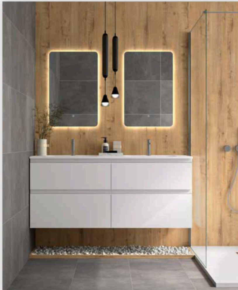
Diseño, funcionalidad y confort en cada detalle

Conjunto diseñado para ofrecer funcionalidad, durabilidad y un alto nivel estético.